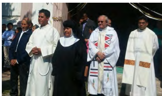
(Abajo a la derecha) El Papa Francisco se reunió con la Congregación General y los Superiores Mayores de los Padres Escolapios y otros religiosos de la Familia Calasancia.