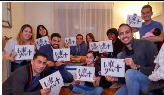
(Dcha./Izda.) Preparación para el Sínodo en NY y PR.