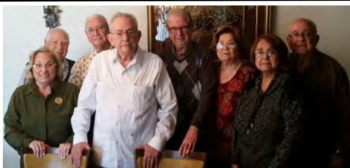
(Arriba a la izquierda y abajo a la derecha) La participación de hombres y mujeres laicos en las obras de una Orden Religiosa es cada vez más importante. Estamos muy agradecidos a grupos como UFEC, UFEV, ITEC, y Movimiento Calasanz.