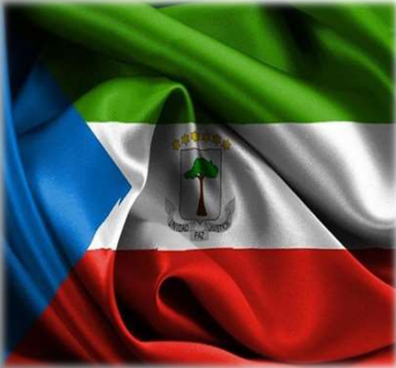
La bandera de Guinea Ecuatorial