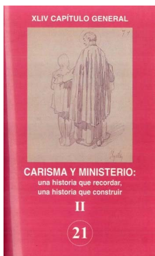
El laicado en las Escuelas Pías (Capítulo General de 1997)

En las Escuelas Pías siempre ha habido colaboradores: es impensable nuestra historia sin ellos. En los últimos tiempos la puesta en marcha de la integración carismática (la Fraternidad) y jurídica introduce una importante novedad en la Orden 35 . Es preciso conocer la reflexión que se está llevando y que se presenta muy ordenada en unos pocos documentos, entre los que conviene ahora destacar: