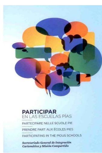
Participar en las Escuelas Pías (Secretariado General IC-MC 2012)

Tras el estudio de esta reflexión conviene destacar algunas consecuencias que comporta la puesta en marcha de la Fraternidad en una Demarcación escolapia: