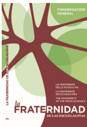
La Fraternidad (Congregación General 2011)