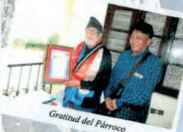
Gratitud del Párroco