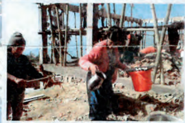
Las mujeres colaboran