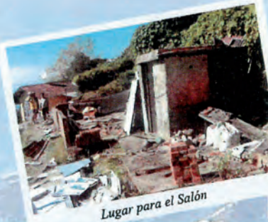
Lugar para el Salón