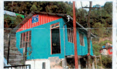
Hall multiuso terminado