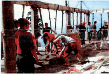
La comunidad trabajando