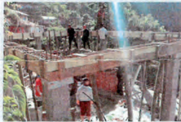
Preparando el techo