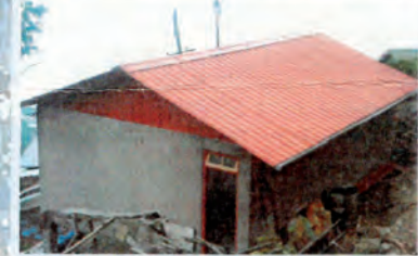
Salón casi terminado