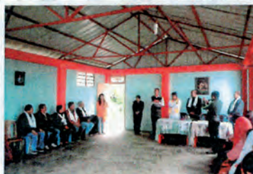
Póster de Calasanz