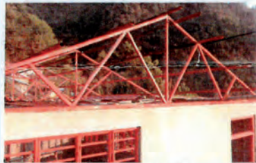
Estructura del tejado