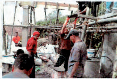
En pleno trabajo